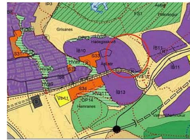
HLUTI ADALSKIPULAGS HAFNARFJARÐAR 2013-2025